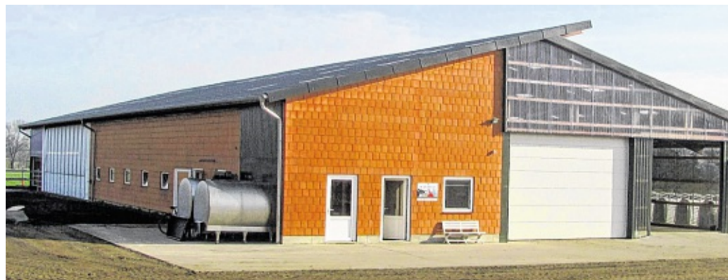
Das landwirtschaftliche Melkzentrum in Hogelund wurde baumäßig begleitet von Hansen & Hansen.