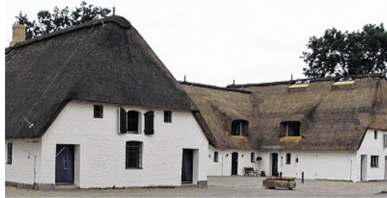
Bekanntes Referenzobjekt ist auch die Mühlenscheune in Schafflund.

Bei den dafür aufwändigen Genehmigungsverfahren entfalten die langjährige Erfahrung und gute regionale Vernetzung des Architekturbüros Hansen ihre positive Wirkung, immer unter Be-